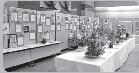
〈かでのアートフェスティバル2018〉