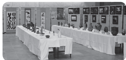
<かでのるアートフェスティバル2018>