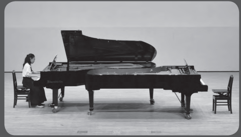
<第11回かでのる音楽スタジオ>