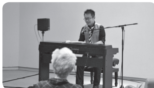
《女性プラザ祭2017オープニングコンサート》

イベント情報は、8月19日現在のものです。追加・中止・変更等の場合がありますのでご了承ください。