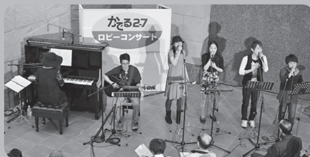
《第103回かぐるロビーコンサート》