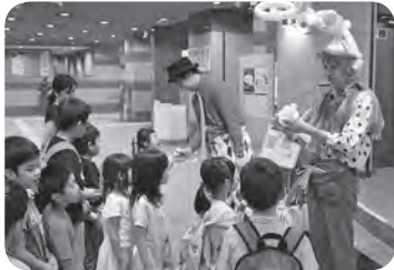
〈ストリートパフォーマンス〉