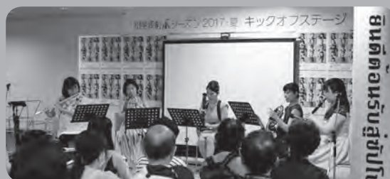
《第23回デリバリーコンサート in チ・カ・ホ》