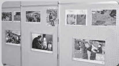
連合北海道/東日本大震災・熊本県を中心とする九州地震パネル展 開催日：4月5日(木)～6日(金)