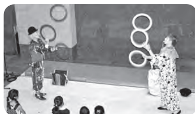
《ストリートパフォーマンス》

内 容：体験コーナー、 キッズクイズラリー、 ゴム銃射撃コーナー、 縁日、絵手紙製作、 ストリートパフォーマンス、 かでの2・7 LIVE ほか