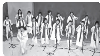
《ゴスペルコンサート》