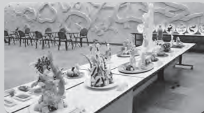
美彫菜研究クラブ作品展示会 開催日：4月11日(火)