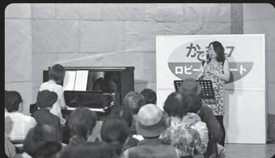
第102回ロビーコンサート