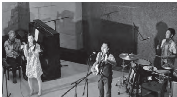
「第100回かでのロビーコンサート」 (平成28年7月)より

イベント情報は、12月19日現在のものです。追加・取り消し・変更等の場合がありますのでご了承ください。