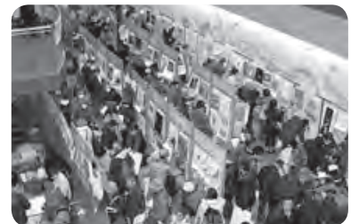
<2017カレンダーリサイクル市>

イベント情報は、11月19日現在のものです。追加・取り消し・変更等の場合がありますのでご了承ください。