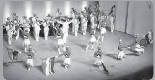
《かでるクリスマスコンサート2016》