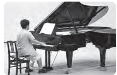
<第8回音楽スタジオ>