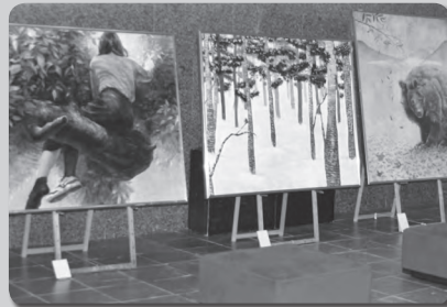
北海道おといねっぶ美術工芸高等学校 木の手づくり展 開催日：8月11日(金)～13日(日)