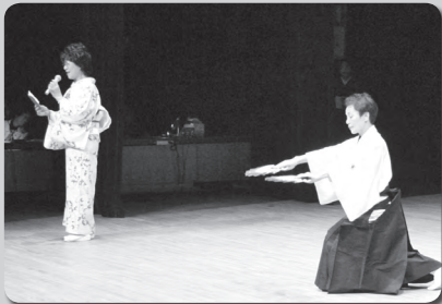
日本コロムビア全国吟詠コンクール 第53回北海道決選大会 開催日：8月6日(日)