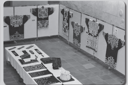
平成29年度アイヌ工芸作品コンテスト 開催日：8月18日(金)～21日(月)