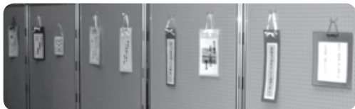
〈「ななかまど」札幌旬会〉