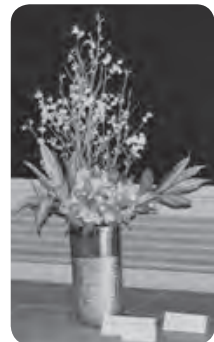
池坊光明流清美会