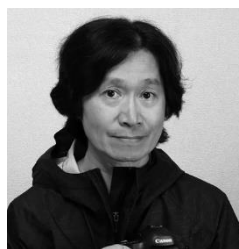
写真家 山本 純一