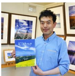
写真家 阿部 俊一